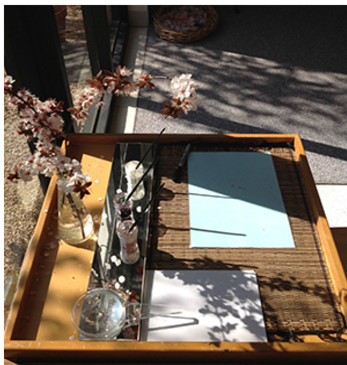
Photo 1 : la floraison, source d'inspiration du travail artistique des enfants dans l'établissement A1