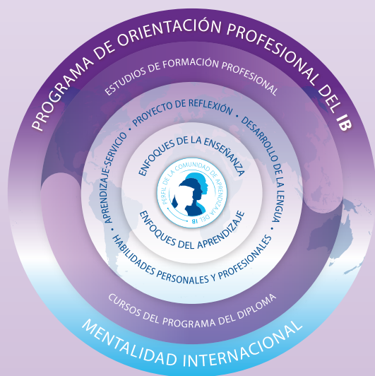
Figura 1: Modelo del POP (IB, 2015)

El modelo del POP consta de tres elementos principales: los componentes troncales del POP (en los cuales los alumnos desarrollan una serie de habilidades, tanto personales como profesionales, y que están formados por el Aprendizaje-servicio, el Proyecto de Reflexión y Desarrollo de la Lengua) los estudios de formación profesional 1 y los cursos del Programa del Diploma (IB, 2014; IB, 2015).